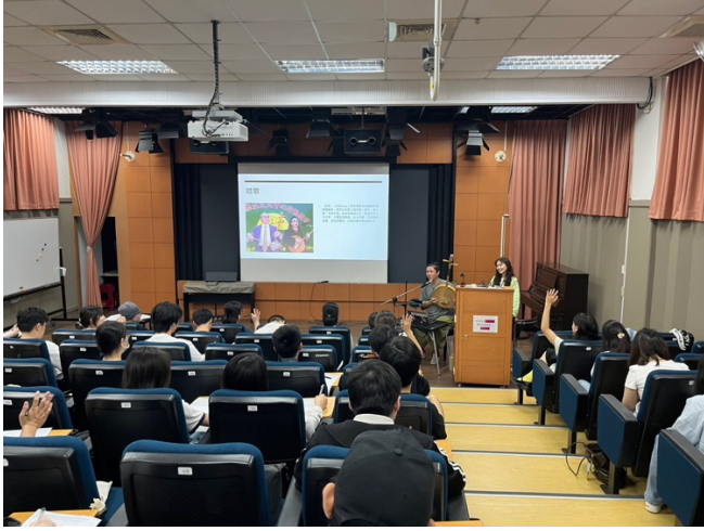
介紹台灣唸歌以及其脈絡