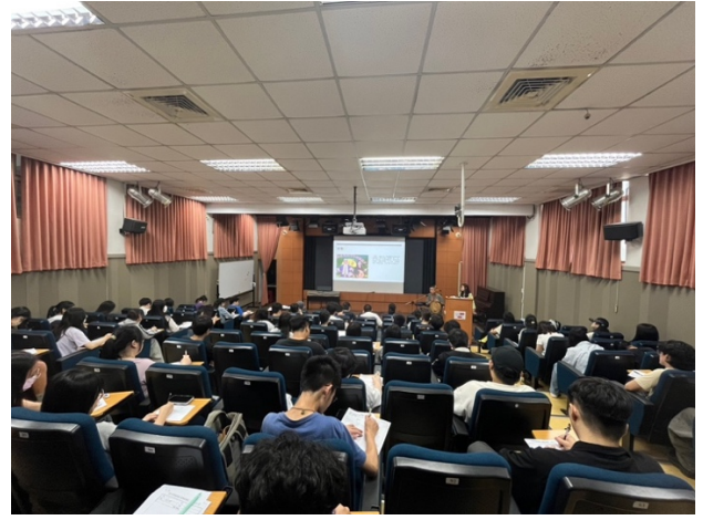
介紹台灣唸歌國寶組合