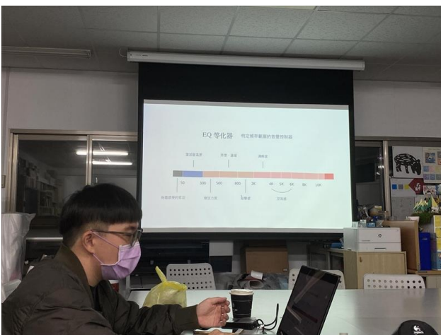
Premiere 之 EQ 等化器介紹