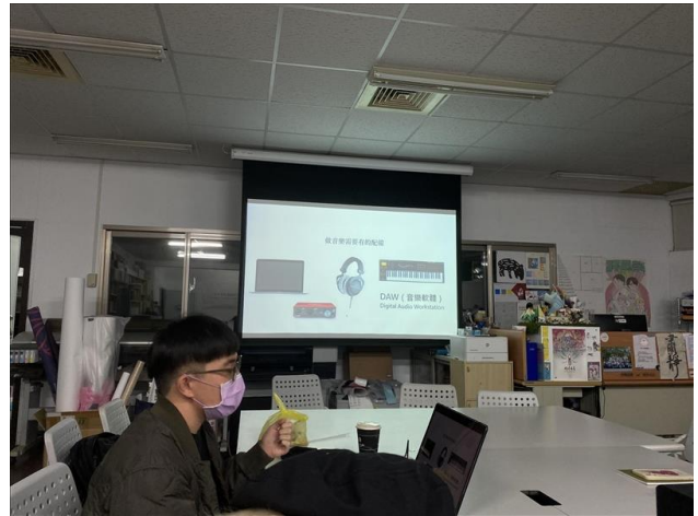
做音樂的最基礎配備需求