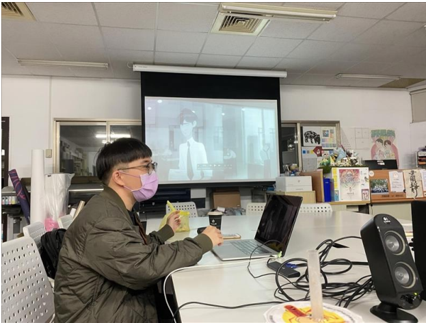
一對一檢討第一堂配樂作業

第二堂課老師針對每個學生的配樂作品個別給予建議與回饋，並更深入的講解上週學生們有興趣的「編曲」領域，同時也介紹了許多可應用的軟體及各個軟體可以處理的聲音面向。