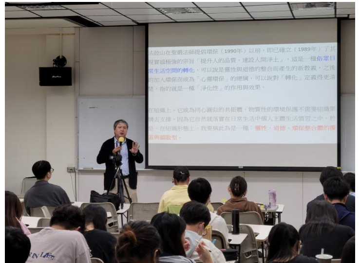
闡述法鼓山心靈環保