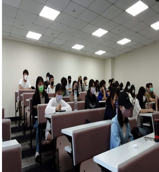
公共人力資源管理 A 班同學聆聽演講