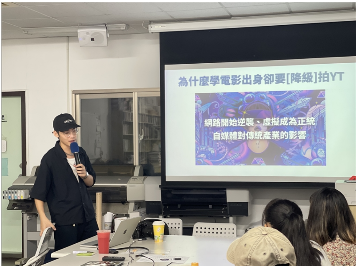
老師分享自己自身經歷

在最後一堂課程中，老師分享了自己許多的故事以及給同學們不只在的拍片時可以運用的思考方式。並且在課程中還加入了調色的實際操作，帶著大家一起說明自己的影片是如何呈現顏色，本次活動共 11 位同學參與。