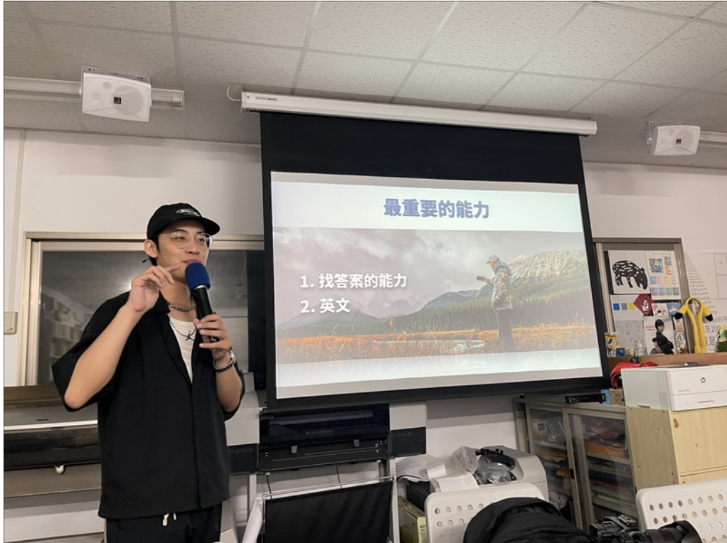
老師分享兩個最重要的能力