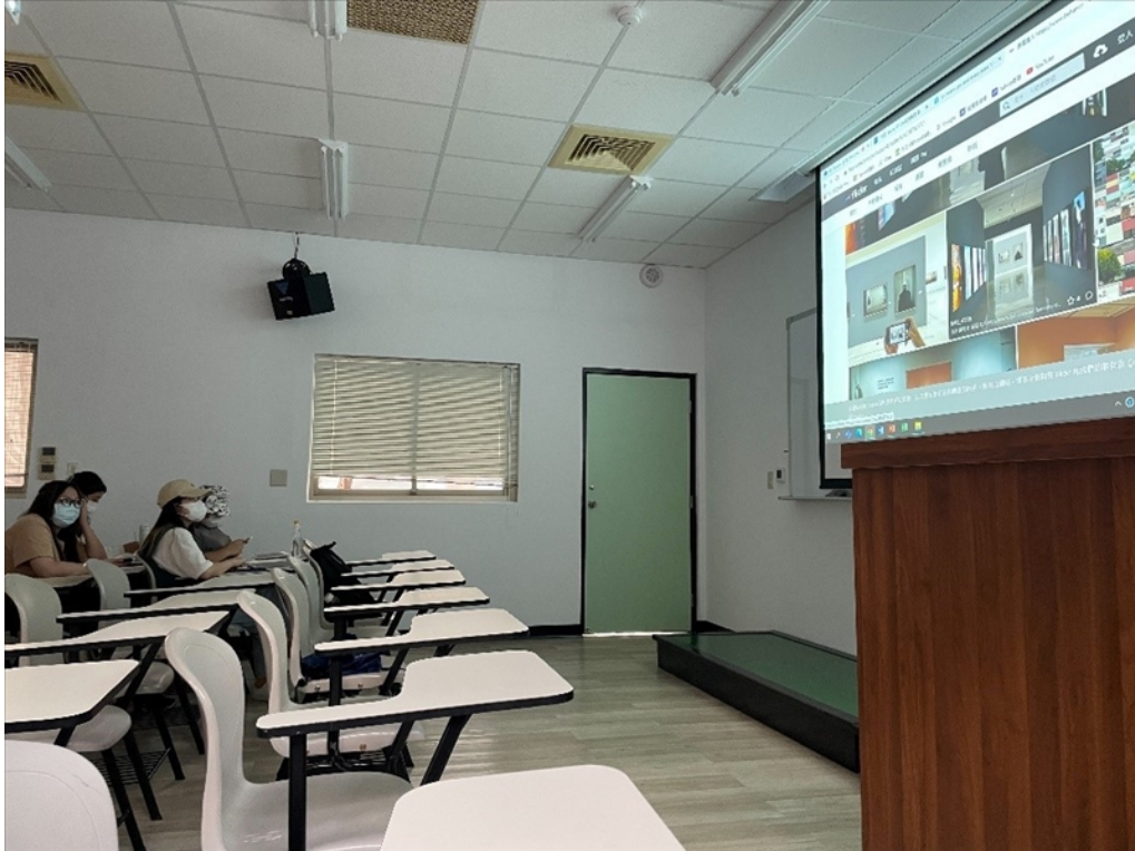
【資傳系專題演講】數位行銷實務：內容產製與定位策略