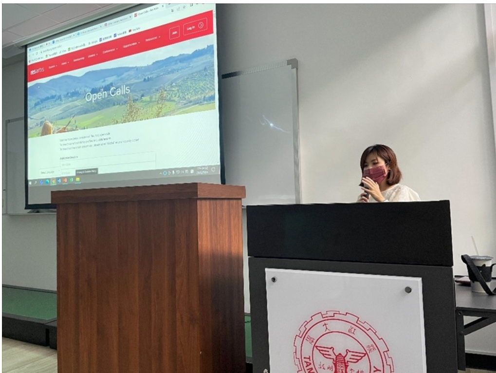
【資傳系專題演講】數位行銷實務：內容產製與定位策略