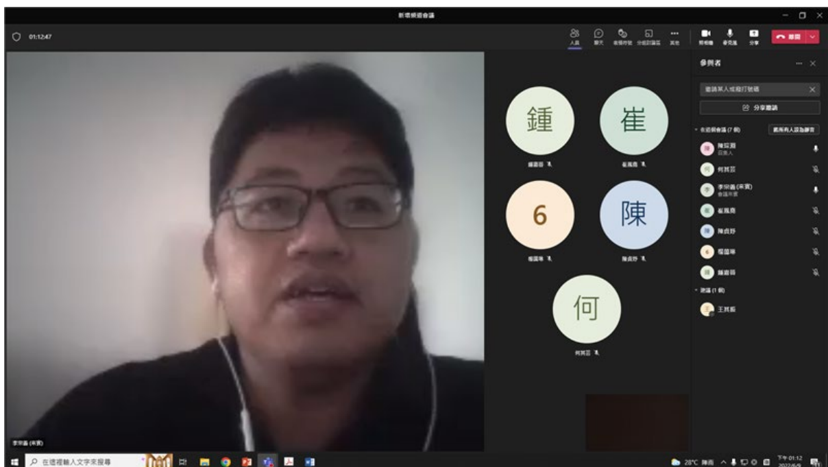
李宗義教授線上演講截圖 3