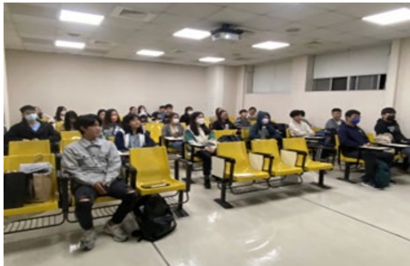
演講時同學們專注聽講