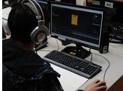
同學練習海報的動態設計