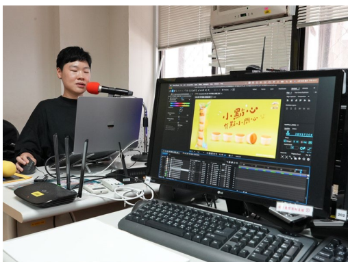
業師解說業界實例