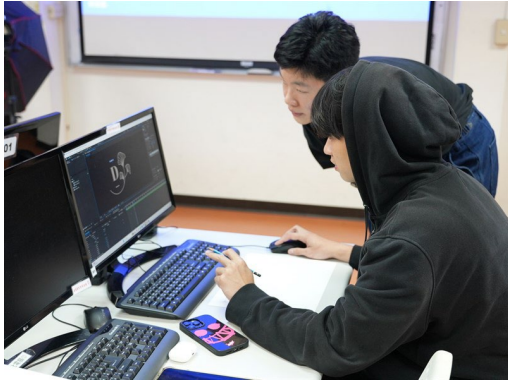
業師給予同學的實作指導