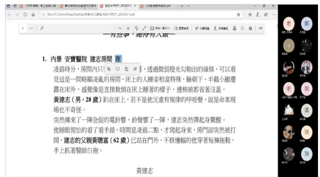
講解劇本書寫排版書寫方式