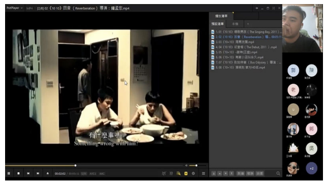
剖析鍾孟宏「回音」之劇本編排