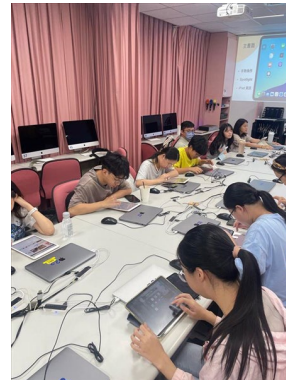
同學跟著講師操作 iPad