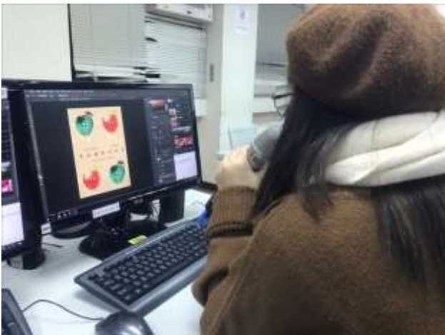
學生提案海報回饋