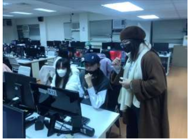
協助學生遇到的問題