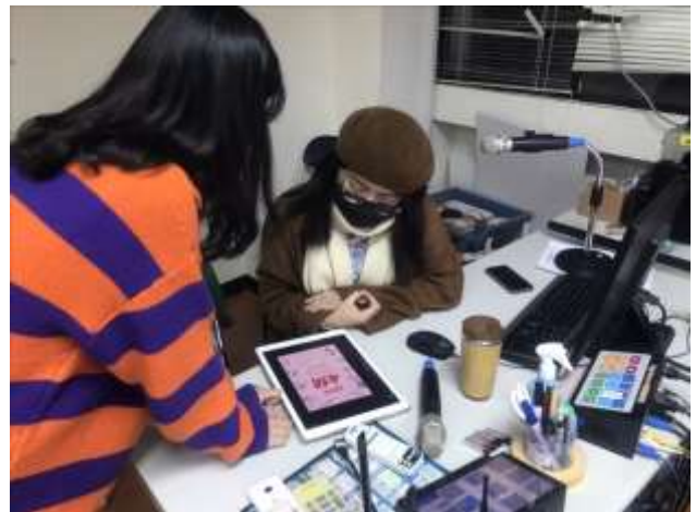
學生提供自己設計的海報諮詢