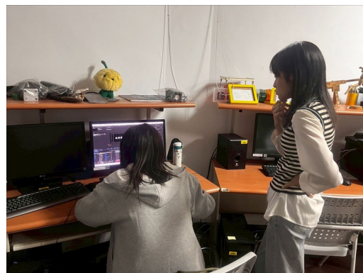
業師幫助同學練習的過程