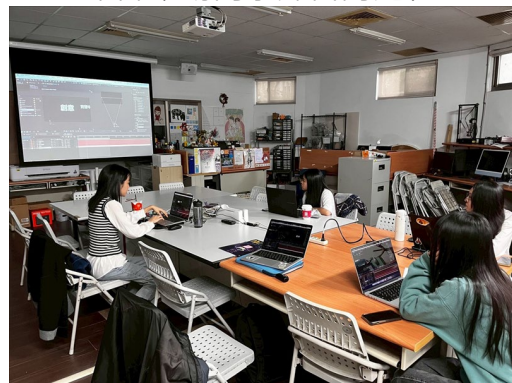
同學認真聽業師介紹攝影機操作過程