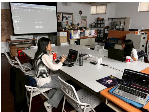
業師說明攝影機運鏡的技巧