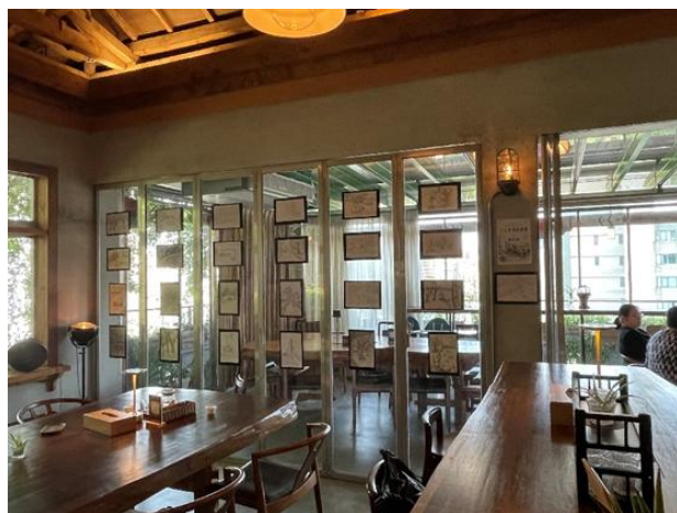
照片說明：展場全景。