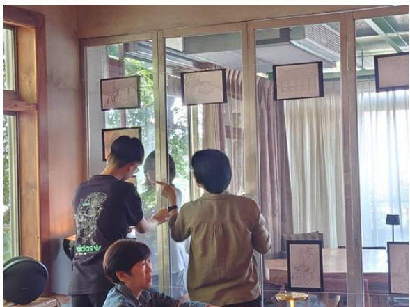
照片說明：戴老師指導展場布置。