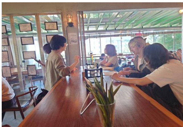
照片說明：戴老師指導展場布置。