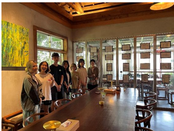
照片說明：完成展場布置。