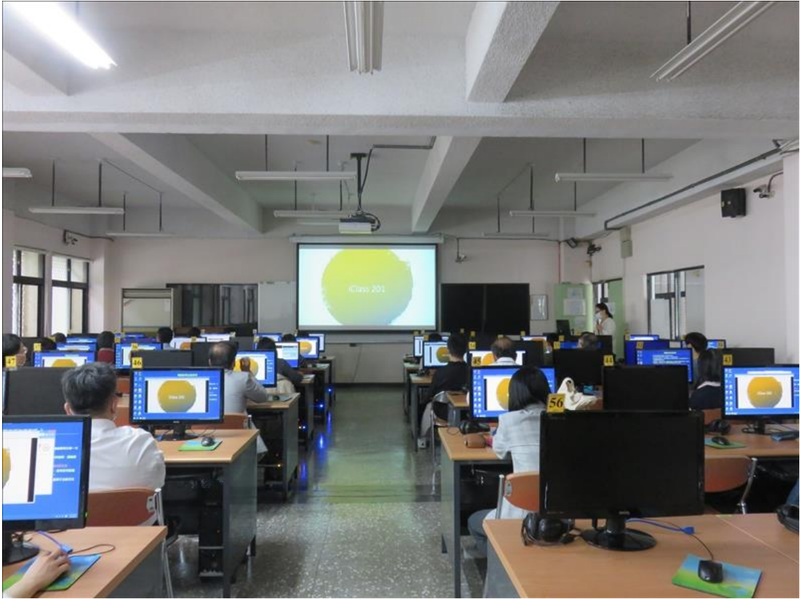
(201)iClass 學習平台教室管理工作坊(0325-1)