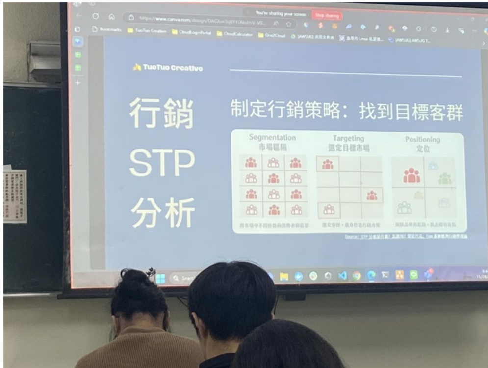
行銷分析內容展示