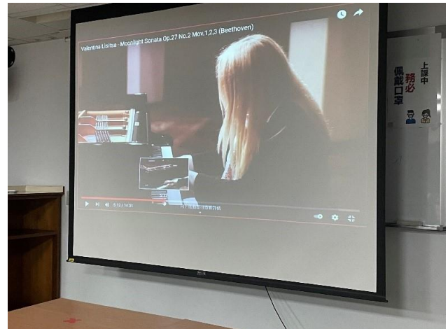
現場聆聽音樂與意義解說