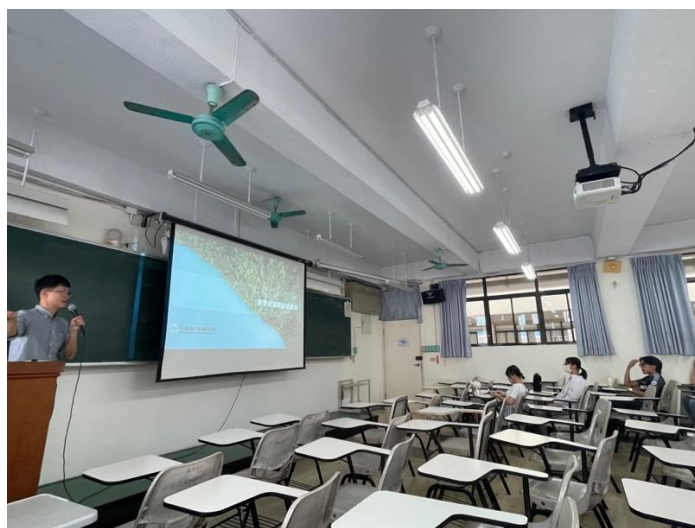
講師介紹政策背景