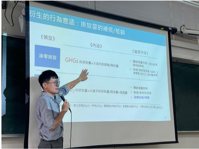
講師介紹淨零排放與碳中和之差異