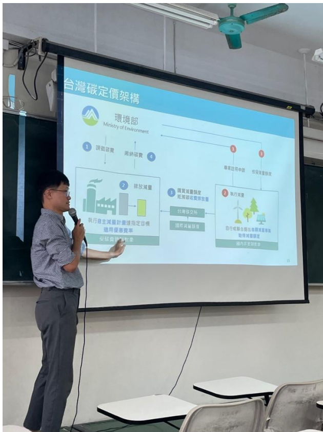
講師介紹台灣碳定價架構