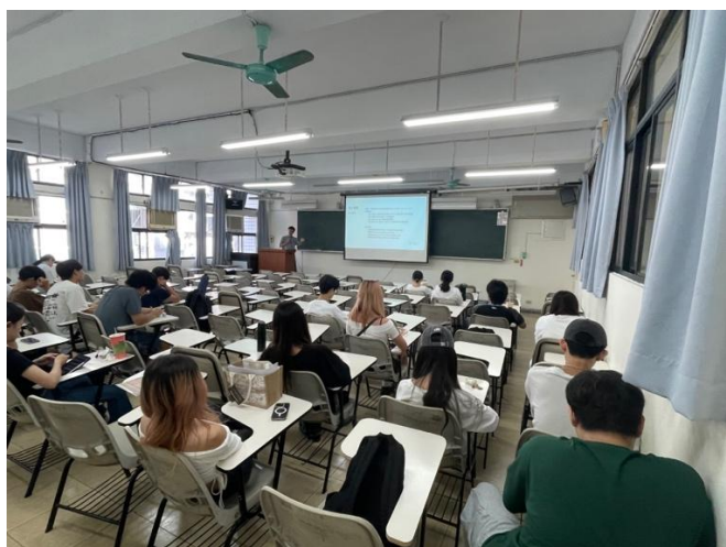
學生們認真聆聽講師分享