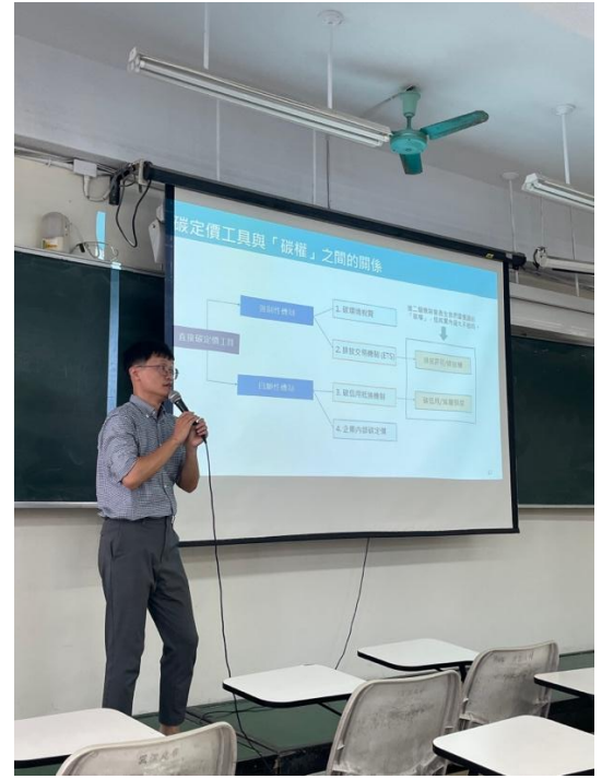
講師介紹不同碳定價工具