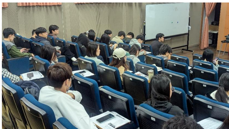
學生專注聽講詩詞吟唱