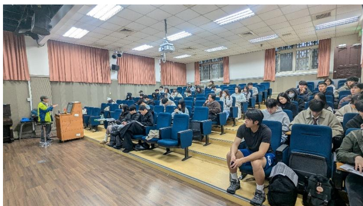
老師的吟唱 學生的專注