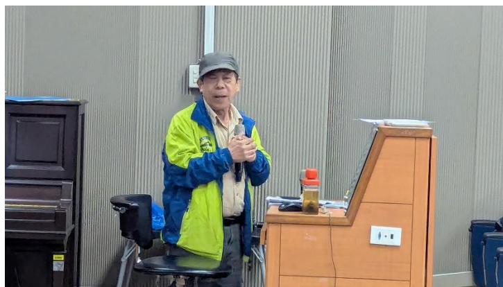
老師說明節奏和吟唱的關聯