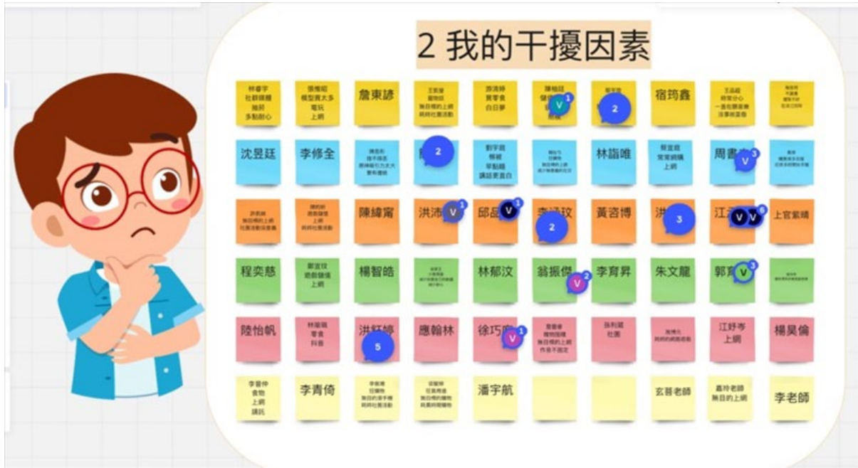
講者於活動過程中利用媒體工具與同學互動(分享干擾因素)