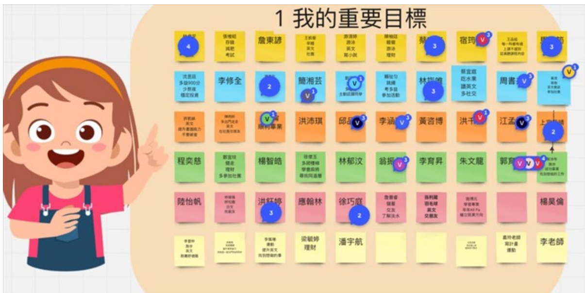
講者於活動過程中利用媒體工具與同學互動(設定我的重要目標)