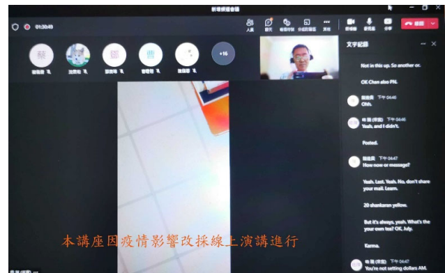
以 MS Teams 進行遠端線上演講