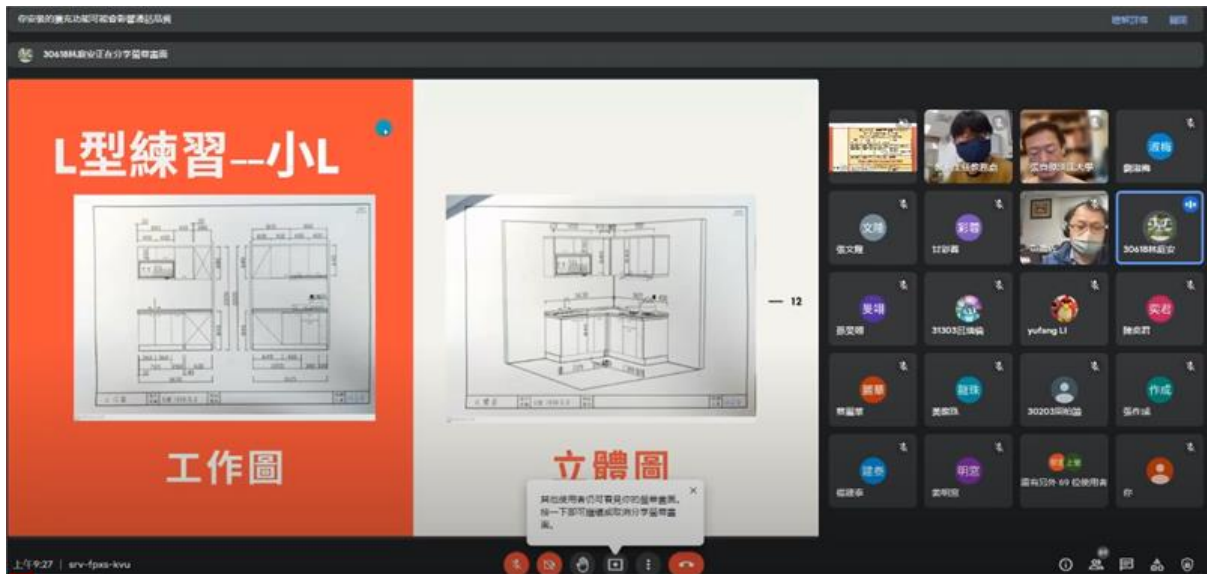
與淡大對談學習歷程檔案工作坊