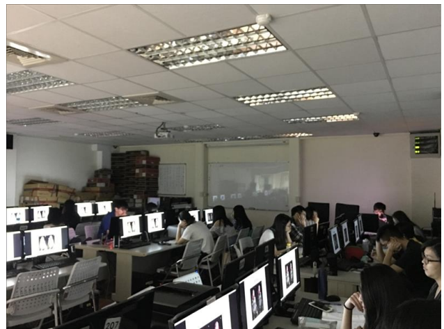
課堂學員認真聽講