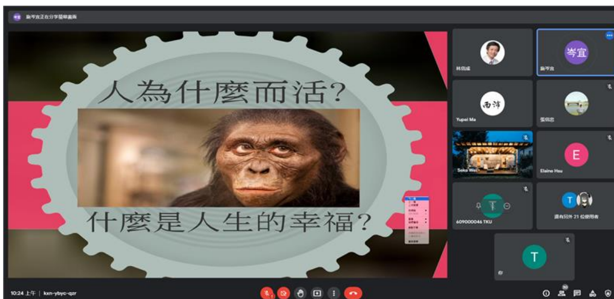
講者從純讀書的知識