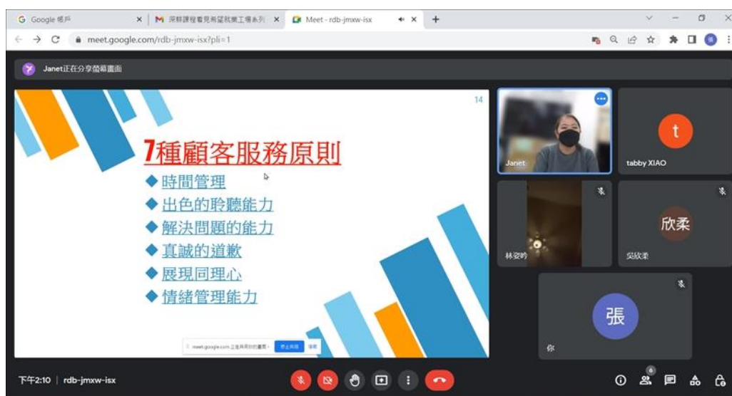
講師說明顧客服務原則