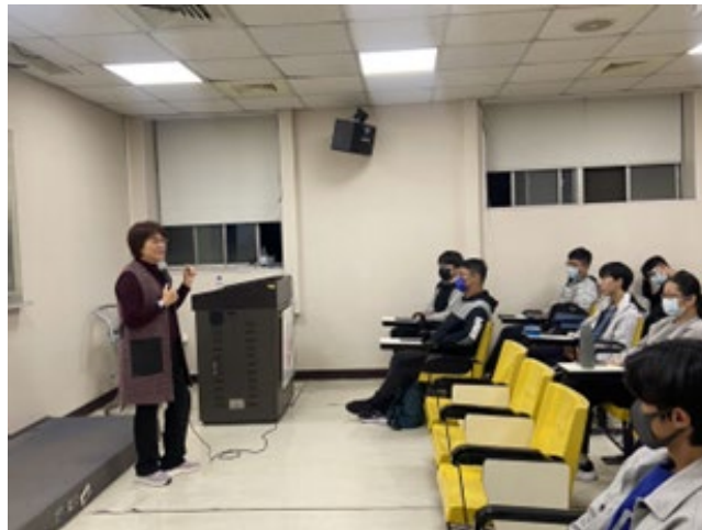
演講時同學們專注聆聽