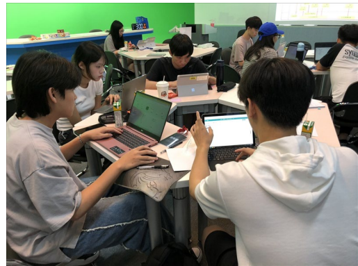
小組討論服務藍圖