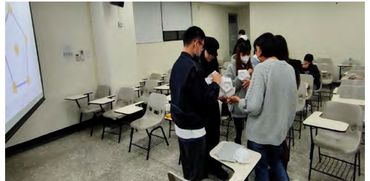
08-12 面體組合 II