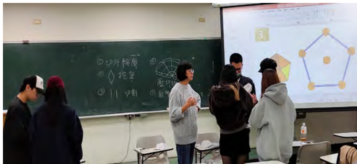
07 學生將各自完成的單面體進行 12 面體組合 I