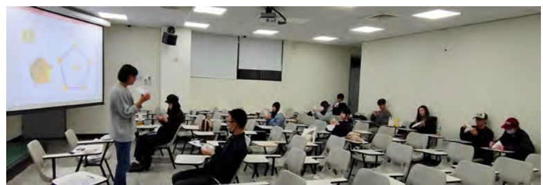
04_演講人示範、並向學生說明製作要領