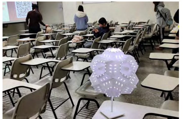
10. 完成組合後的 12 面體「燈罩」