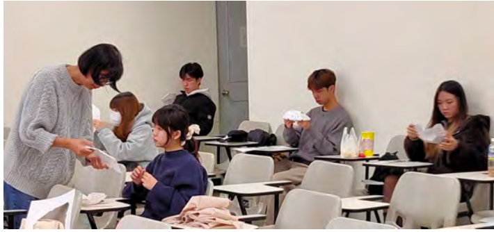
05_學生就 12 面體的單面體進行實作。