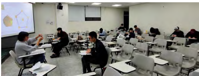
03_演講人講解 12 面體的製作步驟。