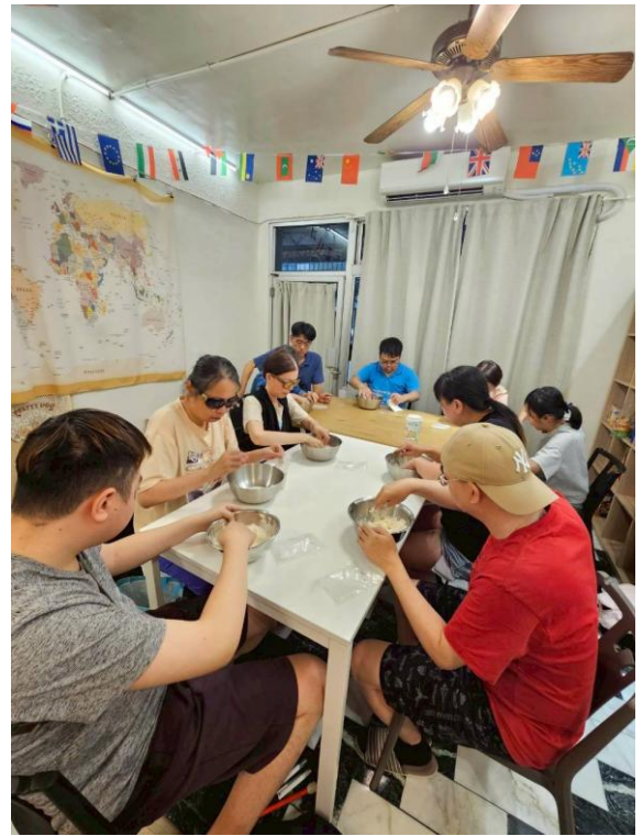
學員操作及練習製作