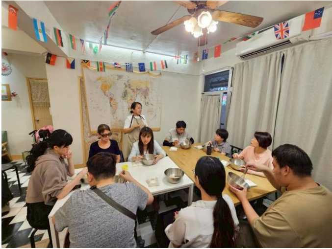
老師解說麵團搓揉的步驟