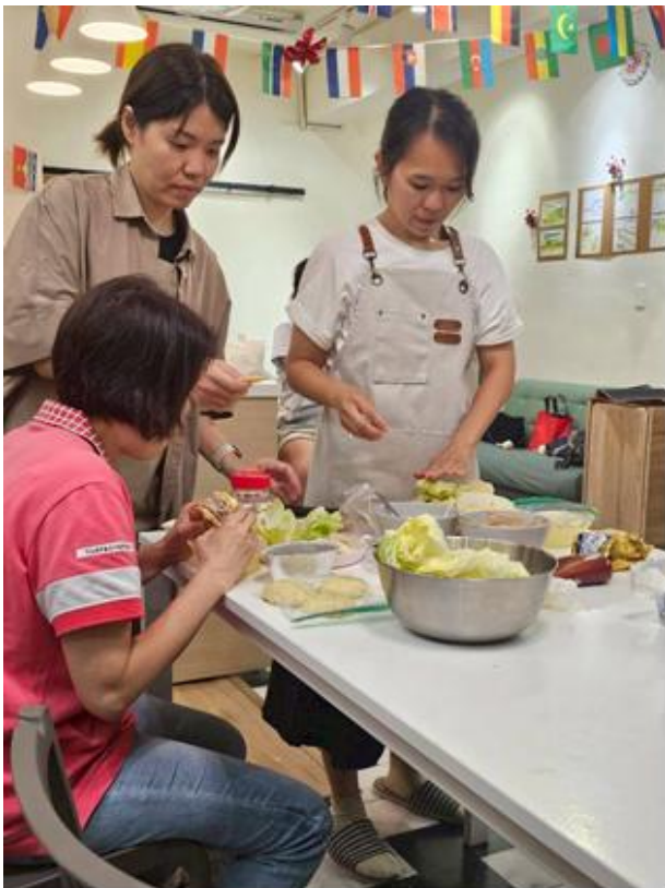
學員互相討論備料方式