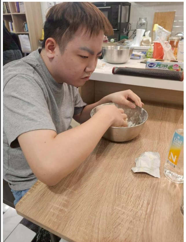
學員個別操作練習