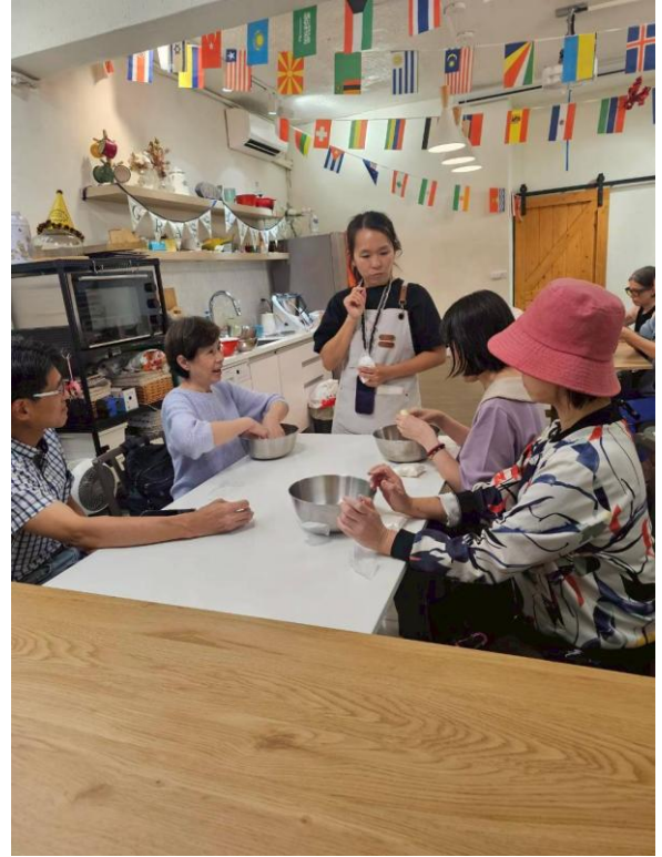
解說材料種類及選購技巧