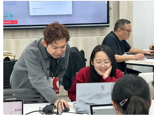
Taiwan AI Labs 團隊協助學生解決問題