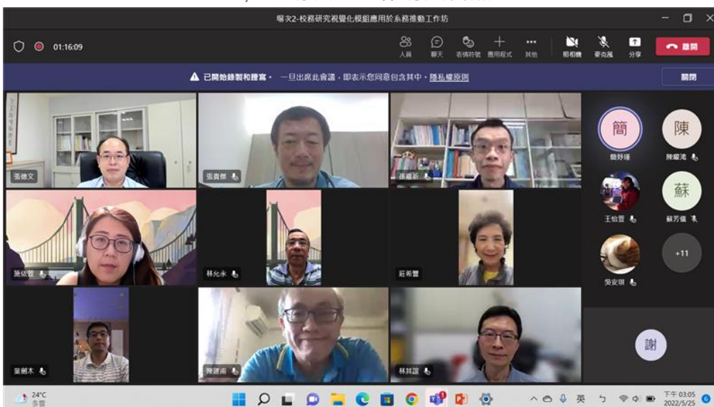
5/25 場次二工作坊大合照