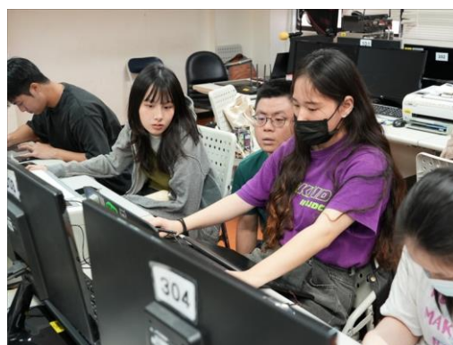
業師講解各個學生實作遇到的問題