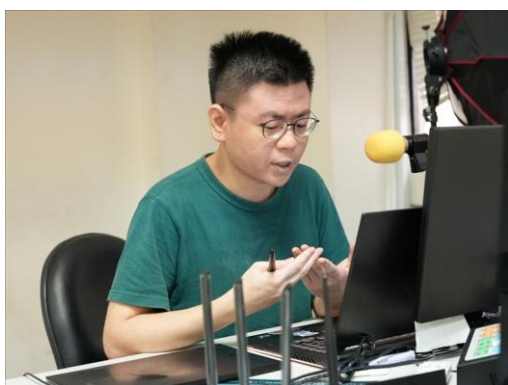
業師講解繪製技巧

學生實作期間，業師細心地為每個學生分別講解繪製時遇到的問題或沒注意到的部分，其中也包含針對個人作品的建議及修正，更舉例提出改善方向，讓學生的個人作品能更加精緻完整。本次活動共 9 位同學參與。