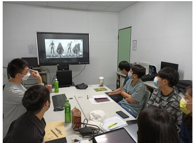
角色設計概念講解—以返校怪物為例