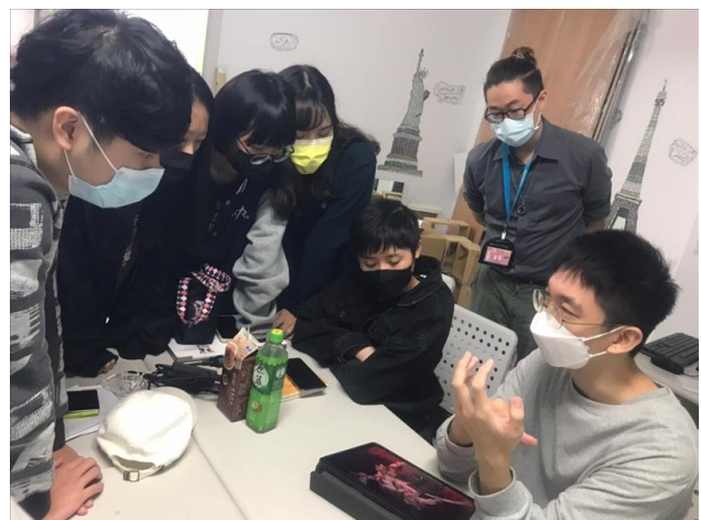
業師點評學生作品