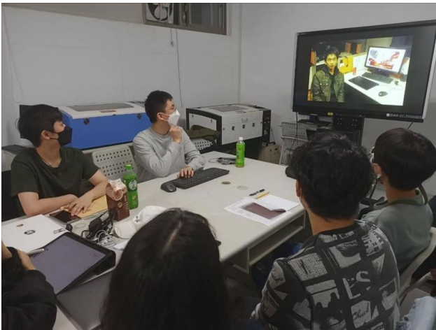
業師於課堂為小組進行職涯經驗分享

在課程尾聲的問與答時間，老師一點評遊戲組與所有旁聽學生的繪畫作品，因材施教給予每個學生不同的技巧與觀念指導，令所有學生不論是在職涯發展上，抑或是美術技術上都得以擁有豐富的收穫。