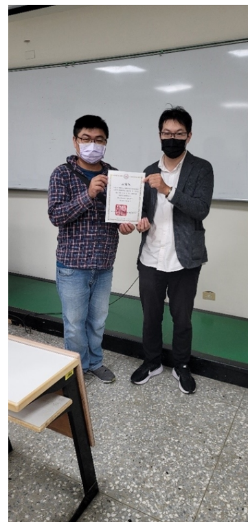
會後頒發演講者感謝狀