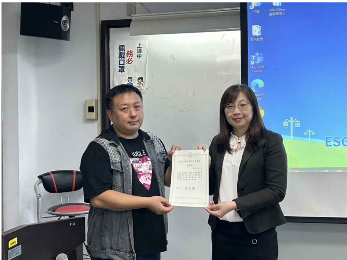
高老師與程老師合影頒發感謝狀