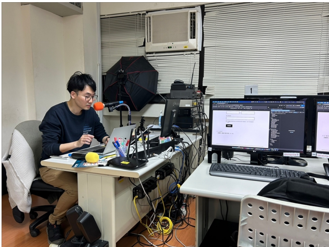
業師解說基本的 Coding 技巧

簡單的排版、明確的色彩計畫、清晰的架構才是大家應該要注意的，勿為追求複雜的功能而忽略了網站應該要注意的基本原則。業師在這三週的課程分享，都使大家印象深刻，大家也對網站架設也有更加深入的認識，並也展現成果。本次分享共 6 位同學參與。