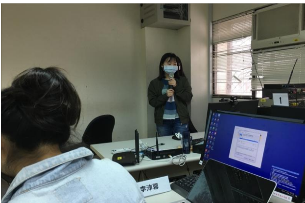
學生報告 Redesign 作業

課程中，老師也利用 Instagram 創辦人 Redesign 的影片作為學習。總結來說，學生們在這次的學習都理解到該如何去 Redesign 一個產品，以及產品設計背後的種種因素。