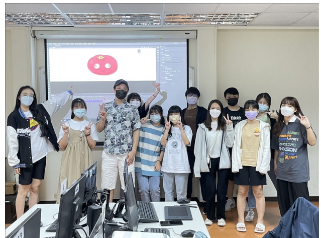
課後動畫組全體與業師合照