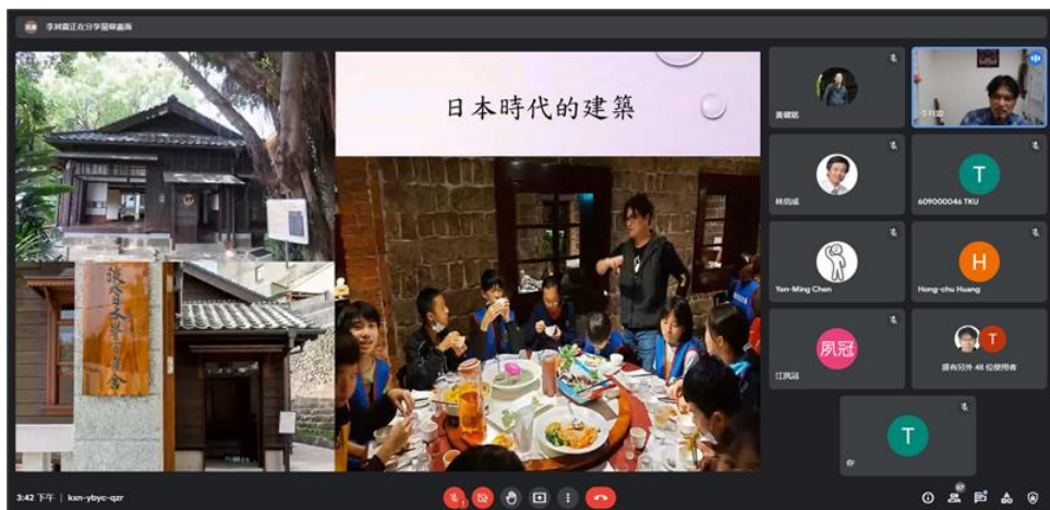
日式建築與滬尾宴