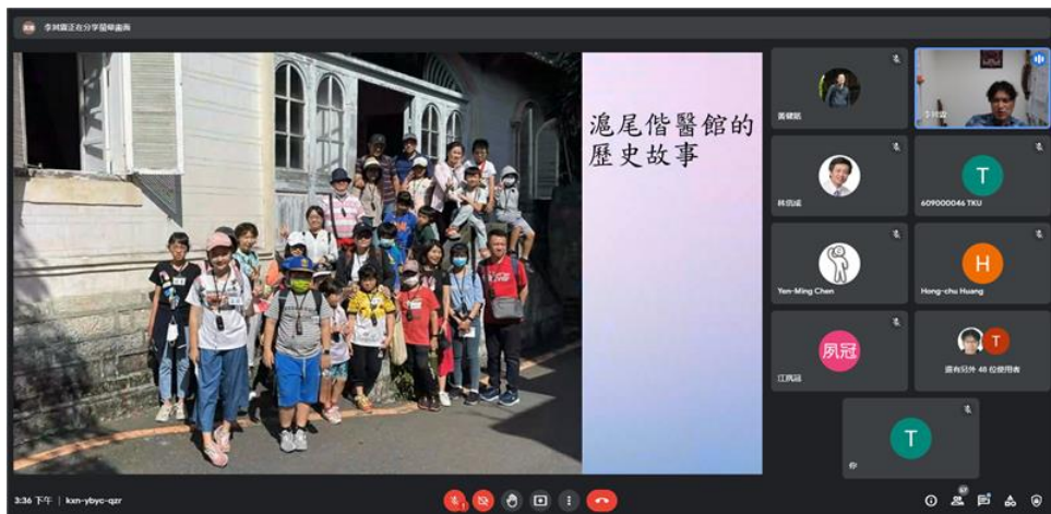
可以跟朋友在偕醫館講的故事