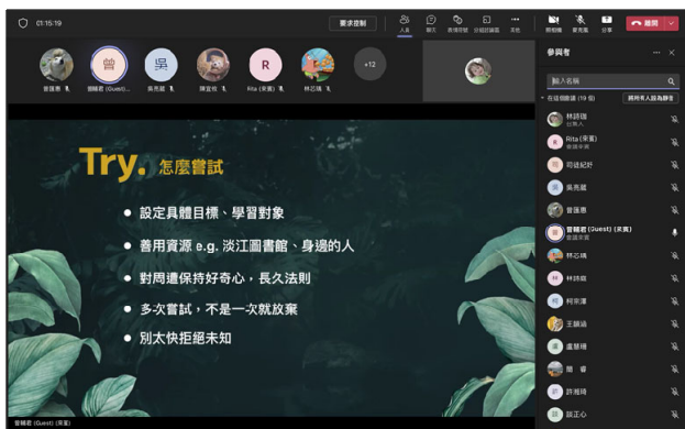
業師提供學生平時可練習的管道 並說明該保有的心態