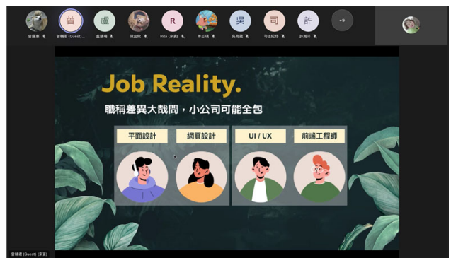
說明各個職位如何協作與配合