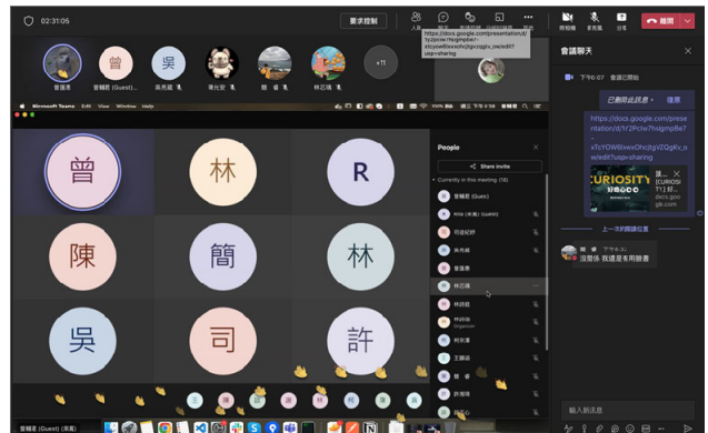
業師課結束 Q & A 與回饋時間