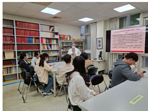
分享「公共圖書館合作共享資源平台」裡的工作坊