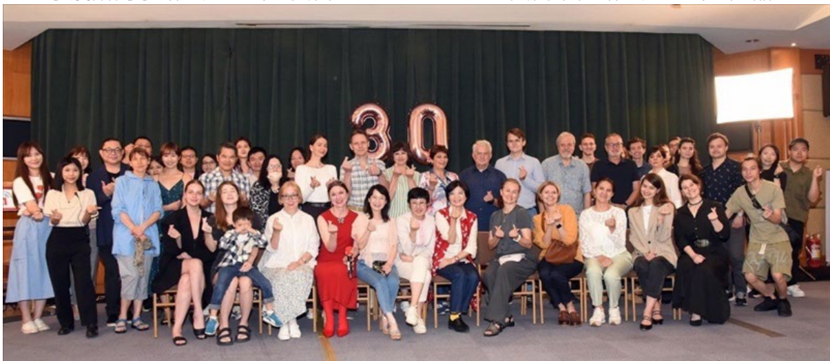
中央廣播電台實習