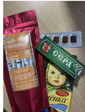
實習單位歐亞之星公司產品