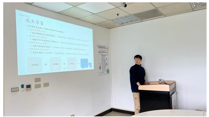
6. Fusion-機構設計繪圖實作社群