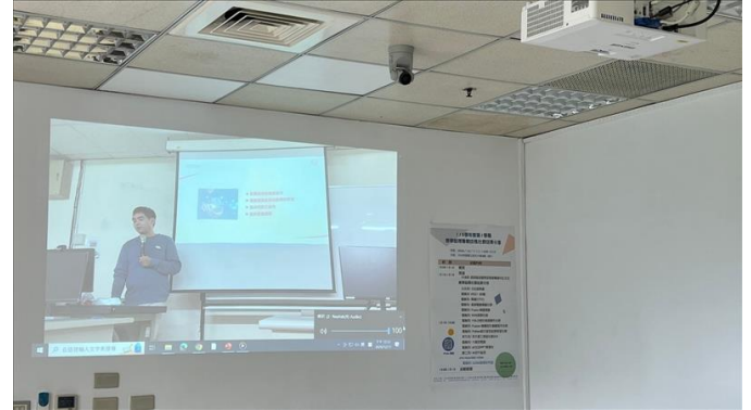
12. E226 教學研究組