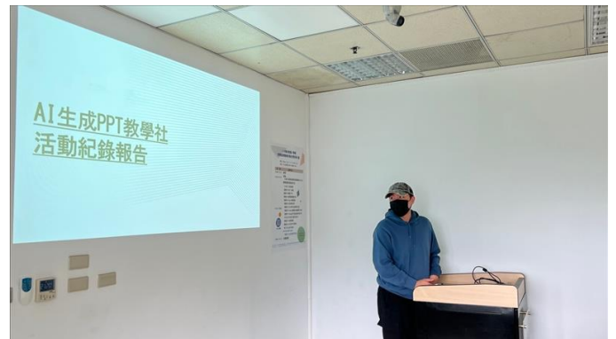
2. AI 生成 PPT 教學社