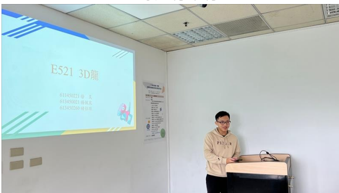
13. E521 3D 龍