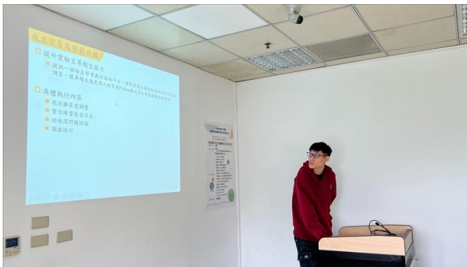
5. Python 程式語言助教研習社群