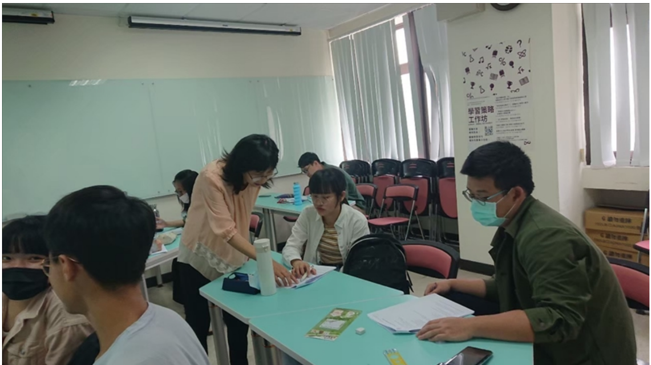
學習策略工作坊「準備英文簡報超 easy」-認識英文簡報架構