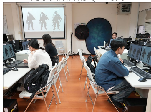
同學認真聽業師介紹角色設計過程