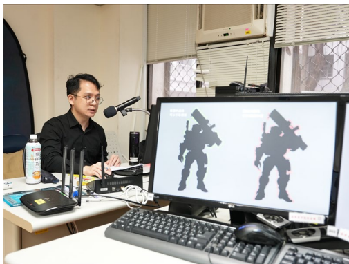
業師說明角色設計的細節差異