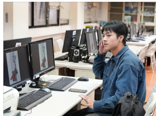
同學與業師的 QA 時間