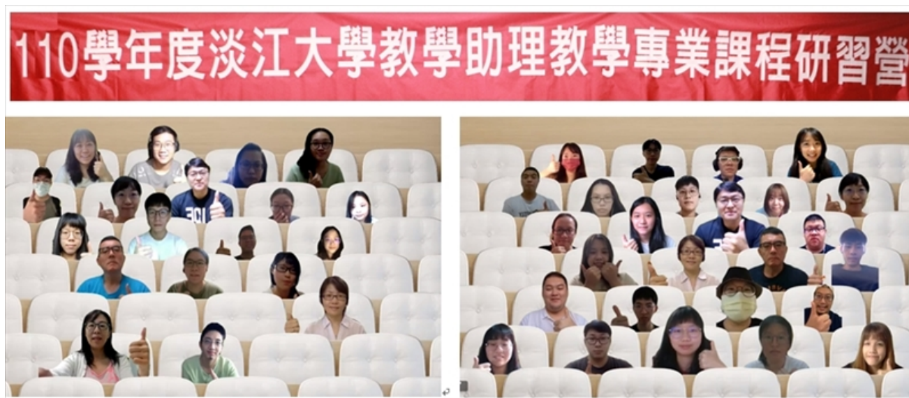
110 學年度淡江大學教學助理專業課程研習營 A、B 組大合照