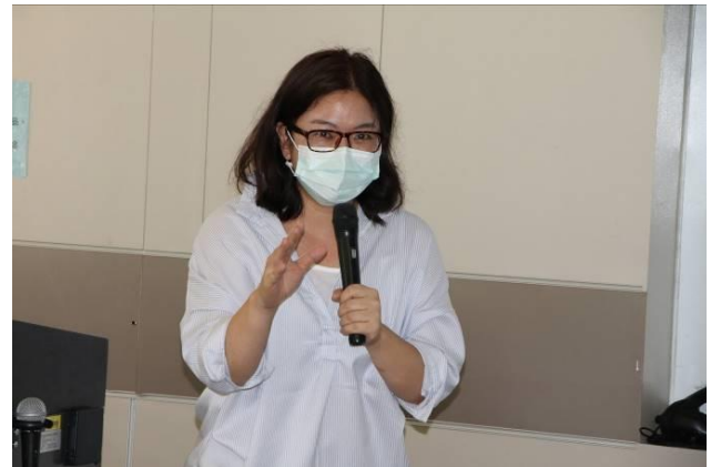
講者分享工作經驗