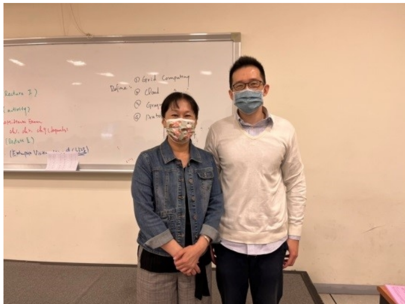
主講者與主持教師合影

本社群的設立宗旨為建立蘭陽校園跨領域研究團隊，共同參與、學習、研究與討論人工智慧的相關議題，尤以深度學習應用於旅遊推薦(Tourism Recommendation)部份為本團隊的發展目標。為此舉辦演講，以影像處理及觀光相關導覽及推薦應用為主要討論部份。