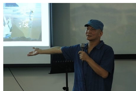
傳主/演講分享創作歷程