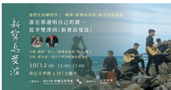
目宿媒體的正式海報

另一種「看/讀」法可能還包括——如何理解駱以軍式的文藝生命？每個在台灣長大的文藝青年、甚或人文學術的工作者，在較年輕的階段，恐怕都很難想像中年後的肉身的戲劇化崩壞，他們/我們可能從精神或慾望上正擁有高度飽滿的能量，或許也憑藉著二十世紀以降的尼采或存在主義式的自決與生猛，高速耗損身體而不以為意。這樣的文學主體及其所生產的因果，是否也到了該誠實面對與反省的新階段？