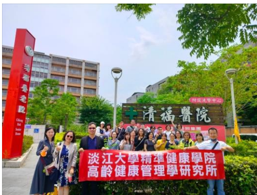
所有參訪人員在清福安養中心合影